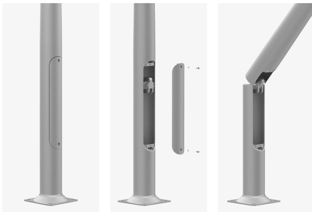
1. Rimozione del coperchio della camera di cablaggio